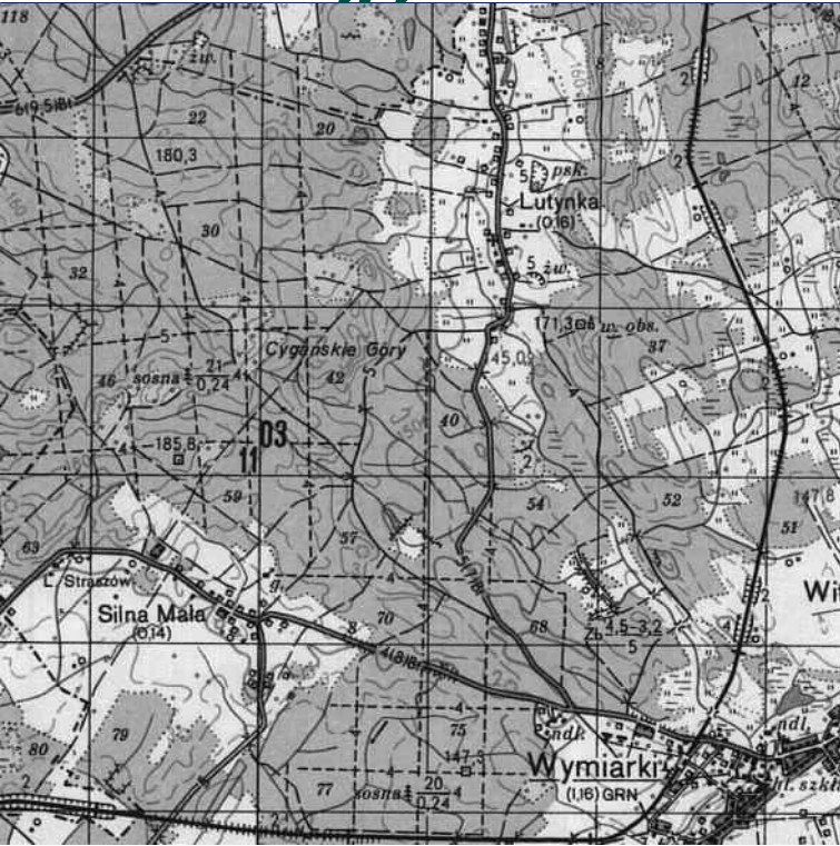
MAPA DO CELÓW PROJEKTOWYCH